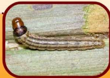
หนอนหัวดำ