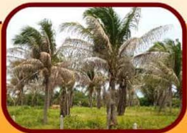
ลักษณะการเข้าทำลาย

i X สอบถามรายละเอียดเพิ่มเติม สำนักงานเกษตรจังหวัดและ สำนักงานเกษตรอำเภอใกล้บ้าน